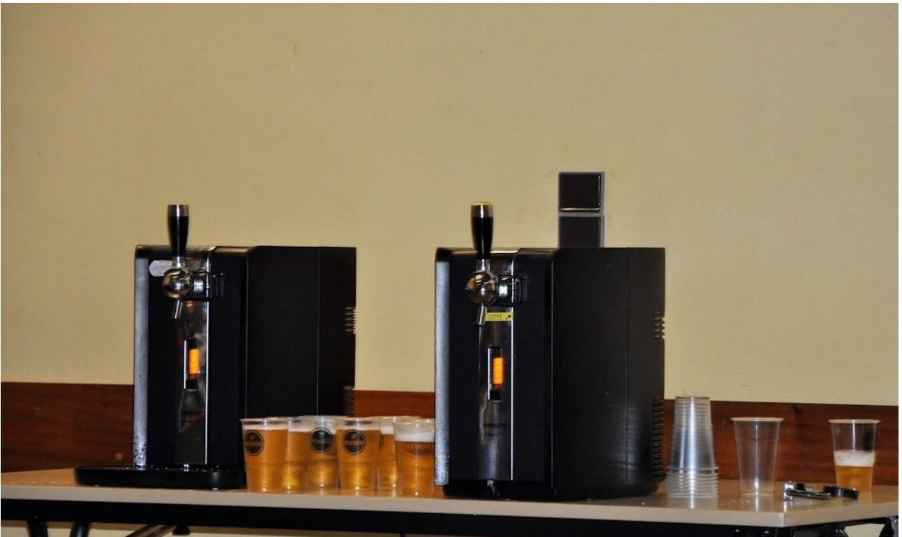
« Les bidons » seront au rendez-vous !