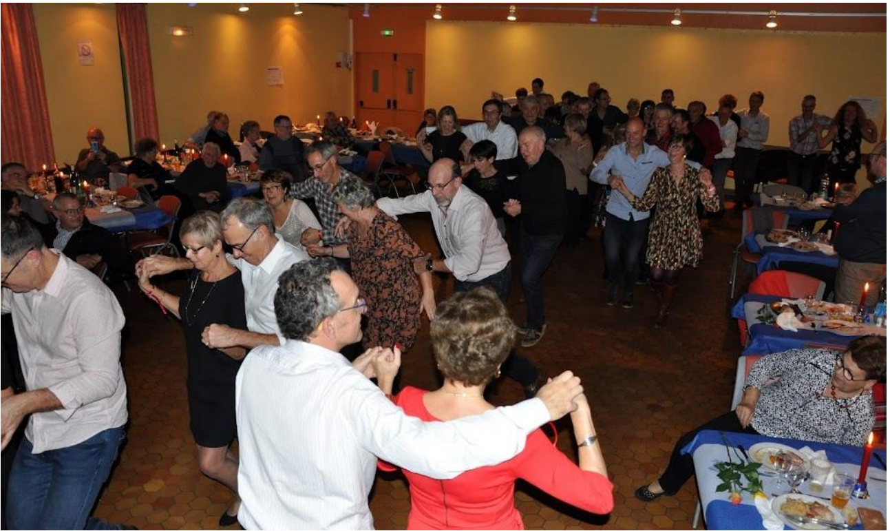
Les danseurs seront présents